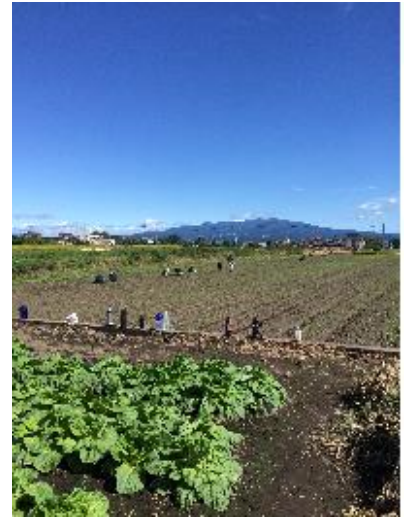
＼9月末には秋晴れも...／ にんじん畑の除草作業