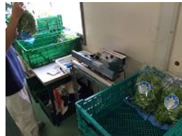
袋口留め(シーラー)