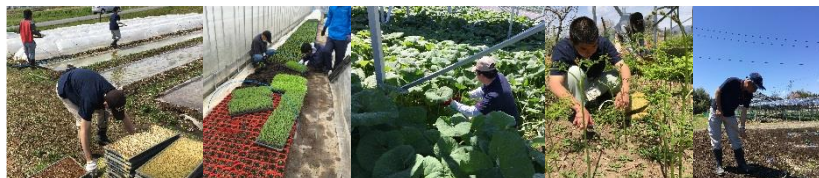
稲のセルトレイのプール出し