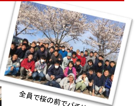
全員で桜の前でパチリ！