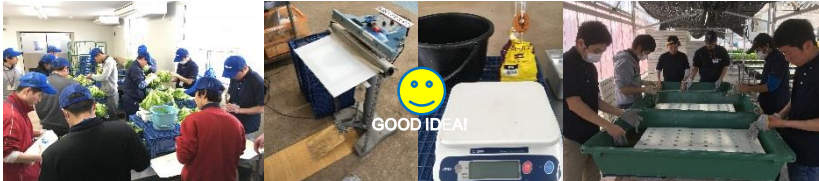
レタスの選果、袋詰め

細ネギ、リーフレタス、ミニセロリ、フリルレタスの選果、袋詰め、パネル交換、洗浄を行いました。