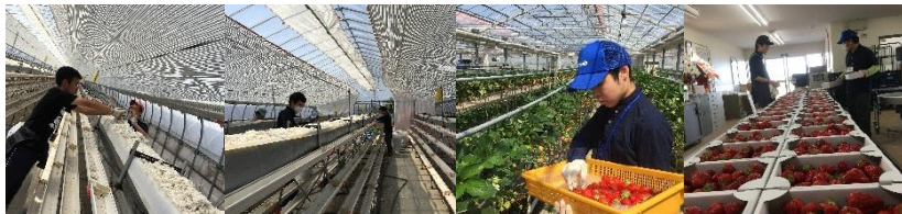
来年用のいちごの苗を植える大切な準備、育苗棟の土をほぐして、土(ロックウール)を入れる作業