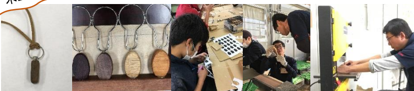
新作のアロマペンダント

11月11日、12日に、メンバーがみなかみの自伐型林業研修に参加しました。12月2日～6日の5日にわたって行われる「全国ナイスハートバザール2017inぐんま」に参加するための準備で大忙しでした。