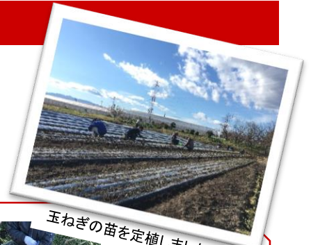
玉ねぎの苗を定植しました。

ジンズノーマ発！毎月の作業レポート ノーマ便り11月号(No.15)です。 早いもので、2017年も残りひと月となりました。10月に行われたスポーツイベント「ノーマリンピック」を終えて、またひとつジンズノーマがチーム一丸となったように感じます。朝晩、冷え込みが厳しい季節になりましたが、体調管理に気をつけながら、元気に冬を乗り越えていきたいと思っています。