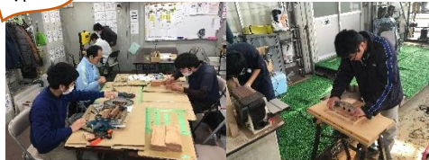
ティースプーンやティープレート の磨きは大事な仕上げ作業