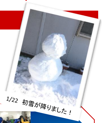
1/22 初雪が降りました!

ノーマ便り(No.17)です。朝の気温が-7℃があったりと極寒が続く中、寒さにも風邪にも負けずノーマスタッフは日々各作業を頑張っております。インフルエンザも流行る季節で、マスクや手洗いうがいなどの予防心がけています。水耕の選果作業では、水を使うため指先が凍るように冷たくなるので、休み時間に大なべにお湯を入れて、手を温めながら寒さを緩和させる工夫もしています。