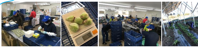
ふきのとうの収穫、選果

じゃがいも、玉ねぎの袋詰め(機械)、ふきのとうの収穫、選果、白菜畑のマルチはがしなど。