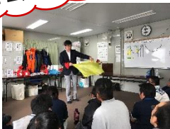
本格マジックにスタッフもメンバーも大喜び！

12月23日(金・祝)去年に引き続き、お楽しみ会を開催することができました。今回は、本格派！マジックによるマジック、スタッフによる余興など、マナー研修の集大成であるMVP表彰式、ビンゴ大会、粉パーティーを行い(たこ焼き、いももち、味噌汁)スタッフ、メンバーの皆で楽しく過ごすことができました。ご協力いただきました皆さん、本当にありがとうございました！