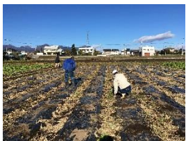
マルチ剥がし作業にも挑戦！