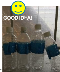
手が冷たくなってしまう選果作業の救世主！？ホットペットボトル