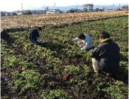
人参、カラフル人参の収穫