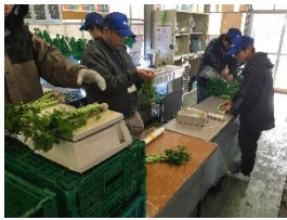
みつばの選果作業、みんな黙々と作業しています。