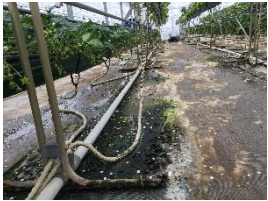
イチゴハウス内の水たまりからコケが大量に発生！へうできれいに削り取りました。

イチゴ狩りが1月からオープンするため、お客様を向かい入れる準備の清掃作業を行いました。