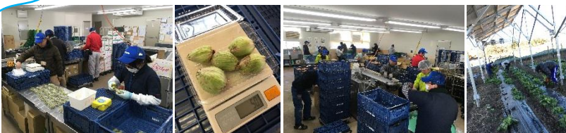
ふきのとうの収穫、選果

じゃがいも、玉ねぎの袋詰め(機械)、ふきのとうの収穫、選果、白菜畑のマルチはがしなど。