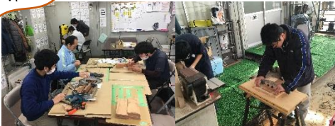
ティースプーンやティープレート の磨きは大事な仕上げ作業