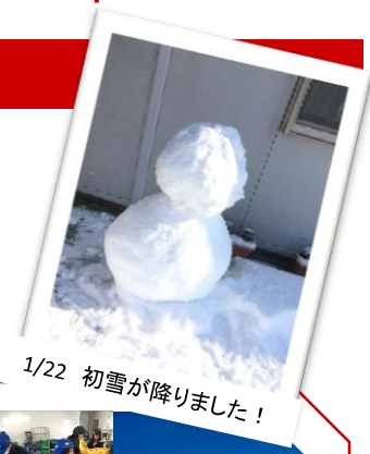
1/22 初雪が降りました！

ノーマ便り(No.17)です。朝の気温が-7℃があったりと極寒が続く中、寒さにも風邪にも負けずノーマスタッフは日々各作業を頑張っております。インフルエンザも流行る季節で、マスクや手洗いうがいなどの予防心がけています。水耕の選果作業では、水を使うため指先が凍るように冷たくなるので、休み時間に大なべにお湯を入れて、手を温めながら寒さを緩和させる工夫もしています。